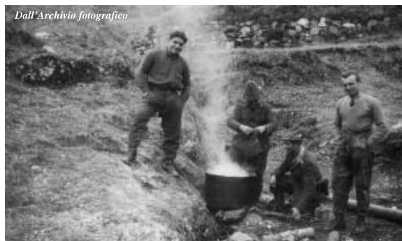
Liguria 1944-1945. Per gli Alpini della Monterosa c'è anche il tempo per...fare il bucato

Abbiamo ricevuto come di consuetudine "Il puntatore", il trimestrale d'informazione dell'Associazione dei Reduci del VI Battaglione Mortai da 81 della Divisione "Cuneo", che riporta una notizia che non avremmo mai voluto leggere. L'Associazione M-81 si è autodiscolta e dopo XXXIV anni il numero di dicembre 2003 porta la scritta ULTIMO NUMERO .