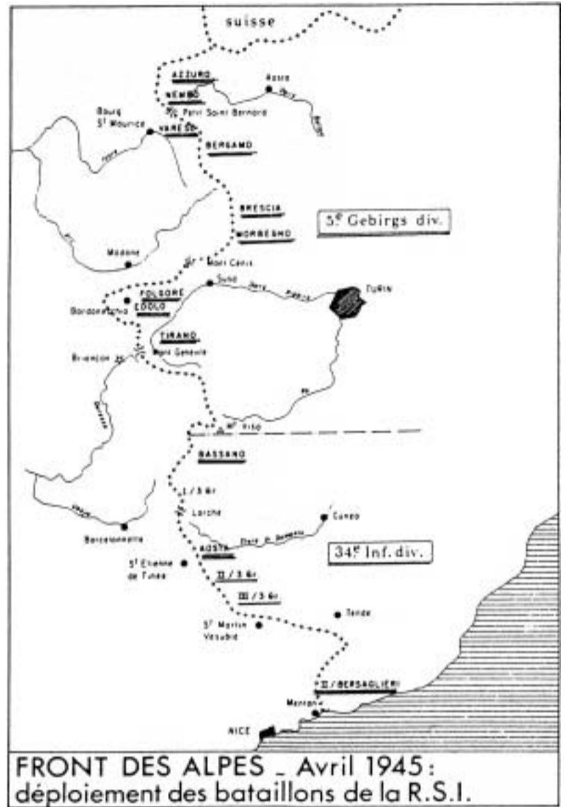
Cartina ripresa da una pubblicazione transalpina della quale non conosciamo il titolo. Ci scusiamo con l'Autore e con l'Editore per la mancata citazione

3° REGGIMENTO GRANATIERI DIVISIONE LITTORIO: nel dicembre 1944 rientra dall'addestramento in Germania e viene destinato alla difesa del set-