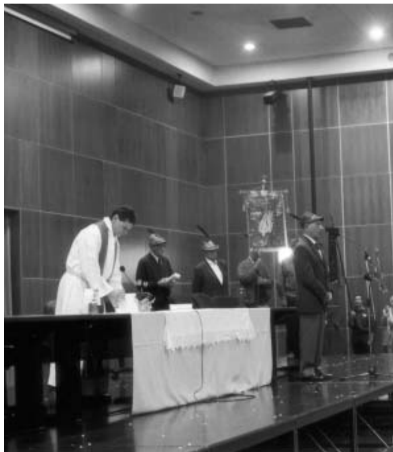
La Santa Messa