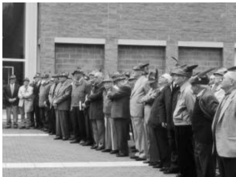
Atta cerimonia dell'alzabandiera